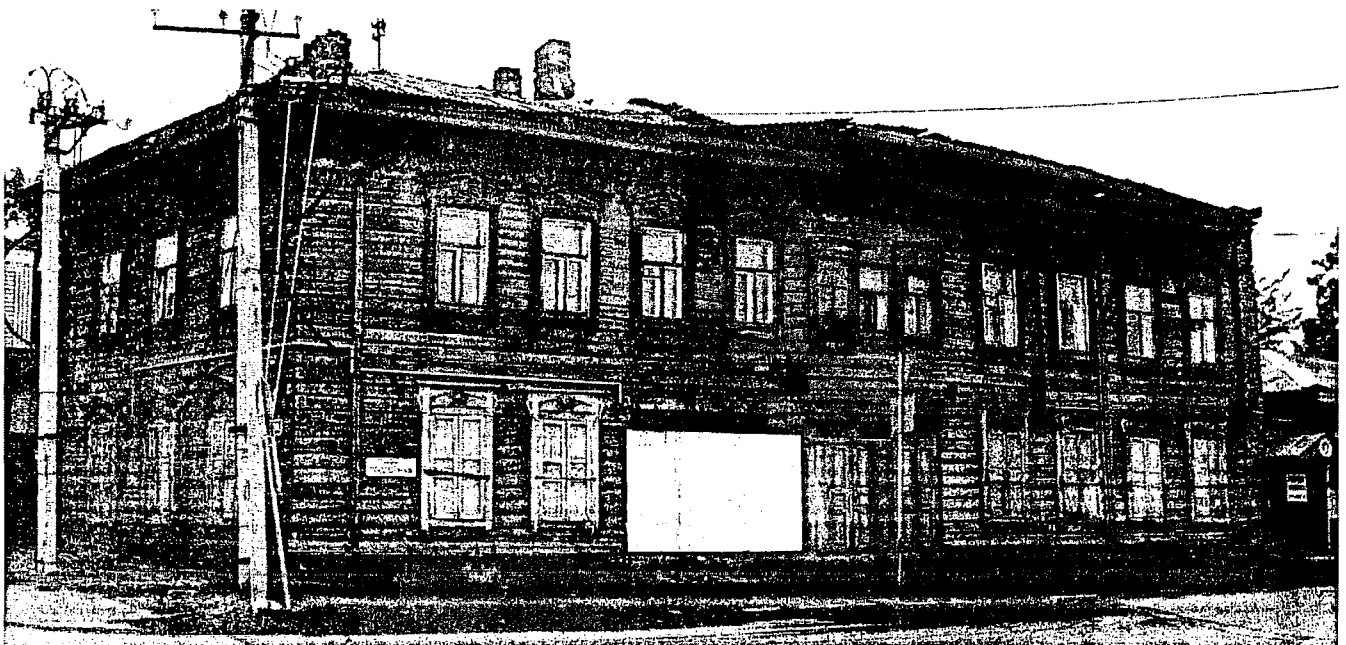
Фото 2 – Главный (северо-западный) и боковой (северо-восточный) фасады