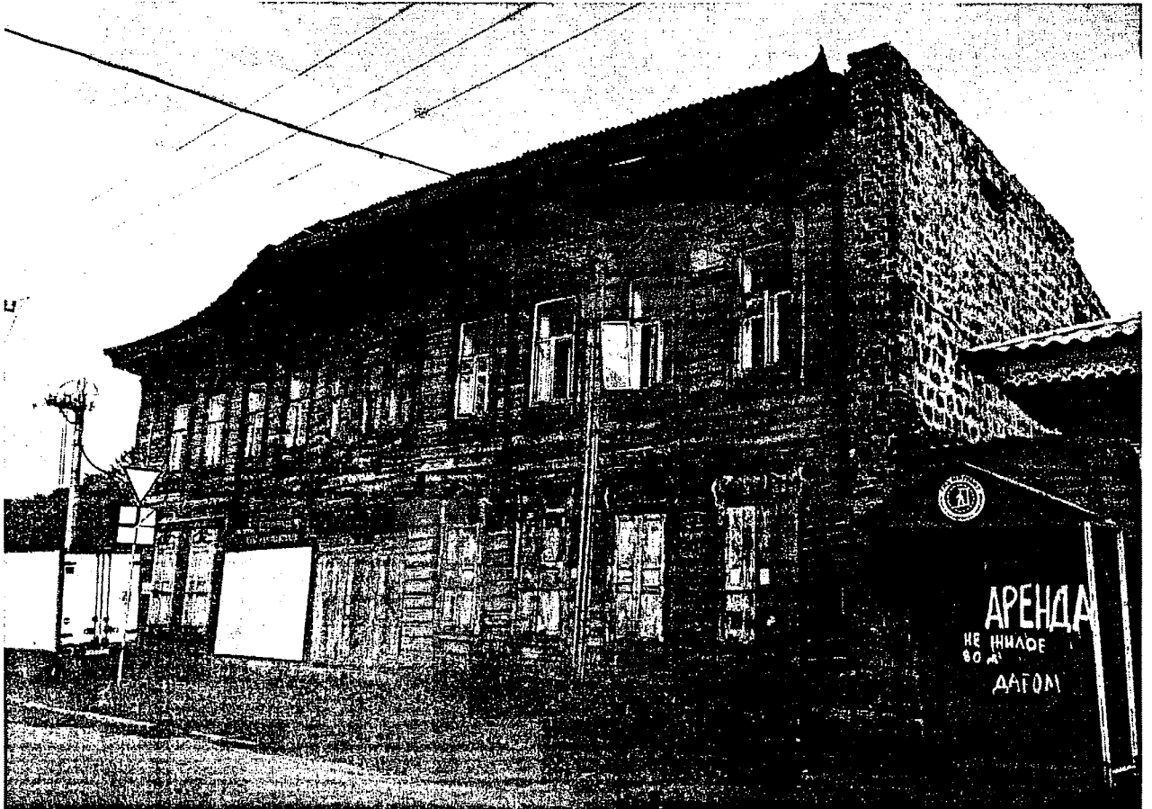
Фото 1 – Общий вид дома (лит. А) с западной стороны, с ул. Подгорной