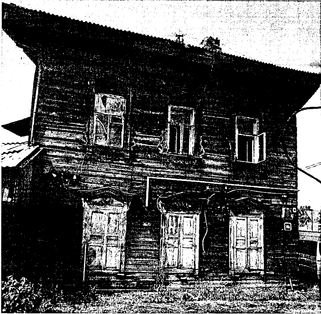
Фото 3 – Северо-восточный фасад, вид с ул. Борцов Революции