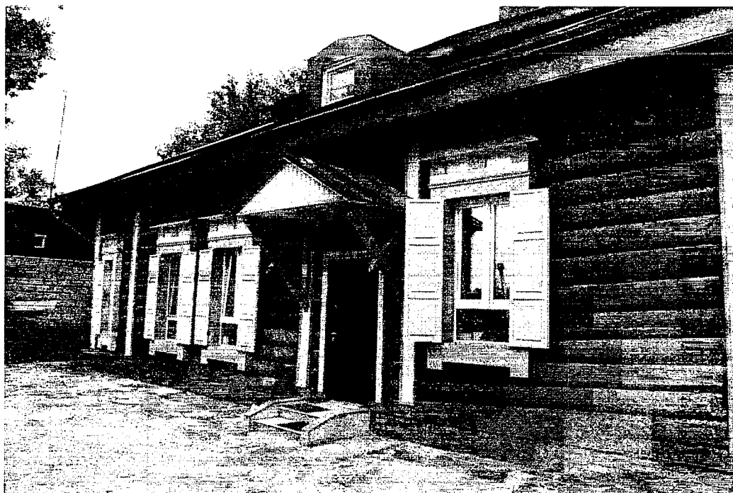
Фото 6 – Северо-западный фасад