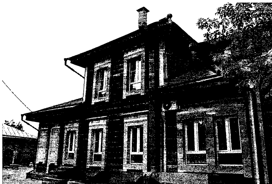
Фото 3 – Юго-западный фасад