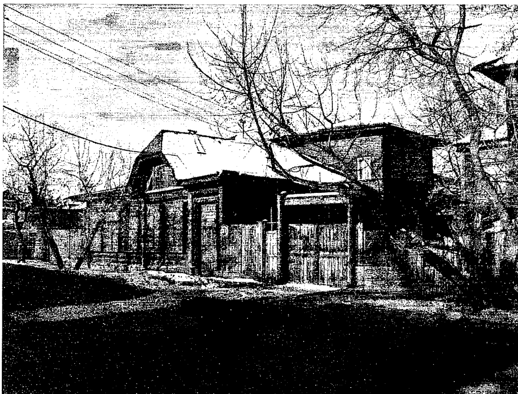
Фото 7 – Архивное фото, 2009 г.