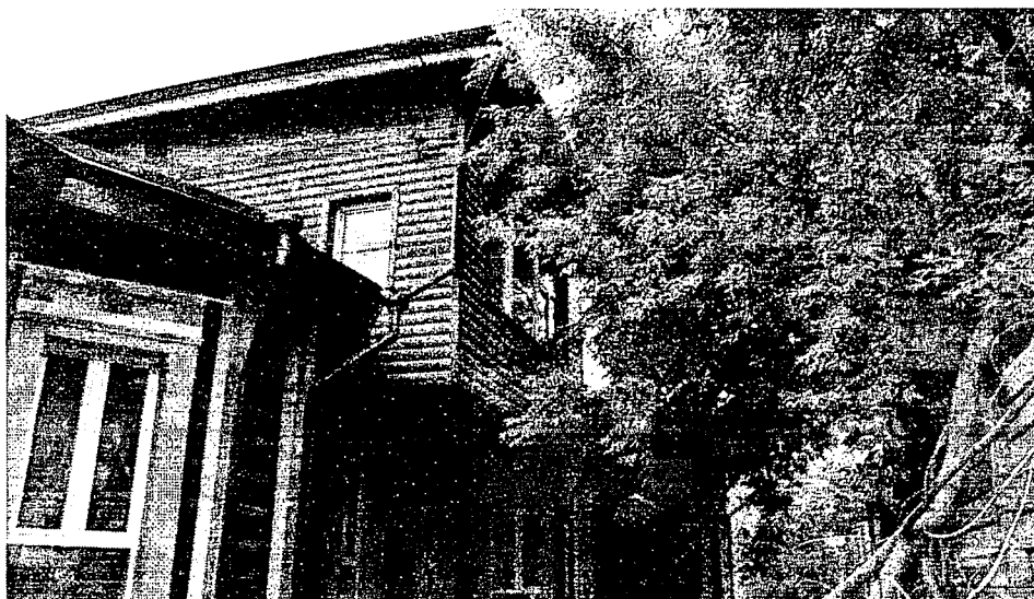
Фото 5 – Северо-восточный фасад