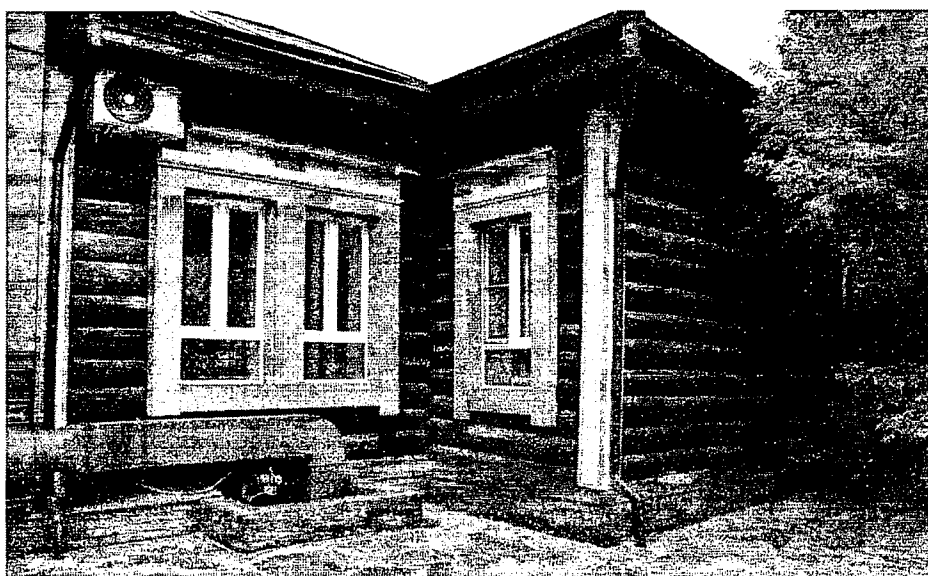
Фото 4 – Юго-западный фасад