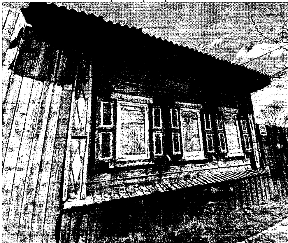
Фото 1 – Главный (юго-западный) фасад по ул. Баррикад