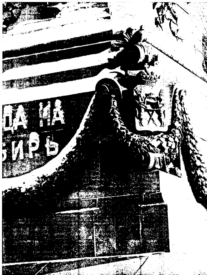
Фото 6 – С западного угла герб Сибирского царства