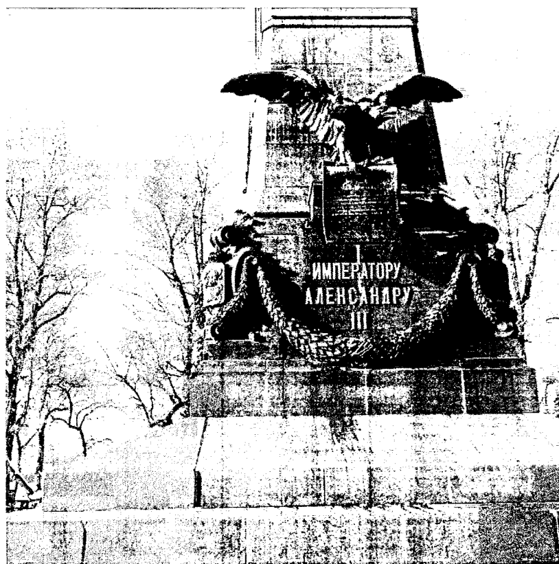
Фото 2 – Общий вид на двуглавого орла со свитком с юго-востока