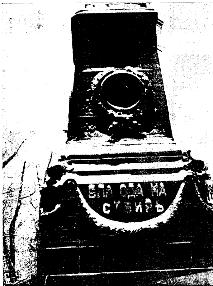
Фото 3 – Скульптурный портрет Ермака