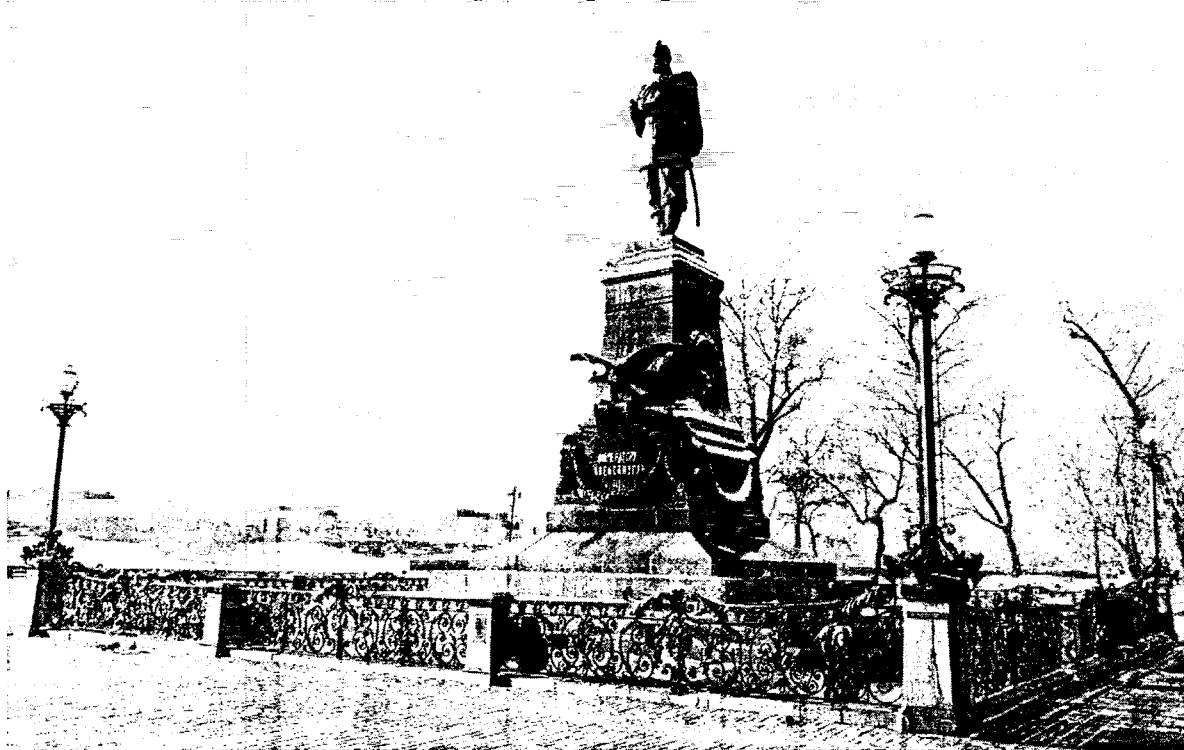
Фото 1 – Общий вид на обелиск с востока