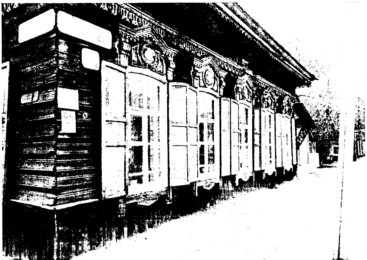
Фото 2 – Фасад по улице Сурикова