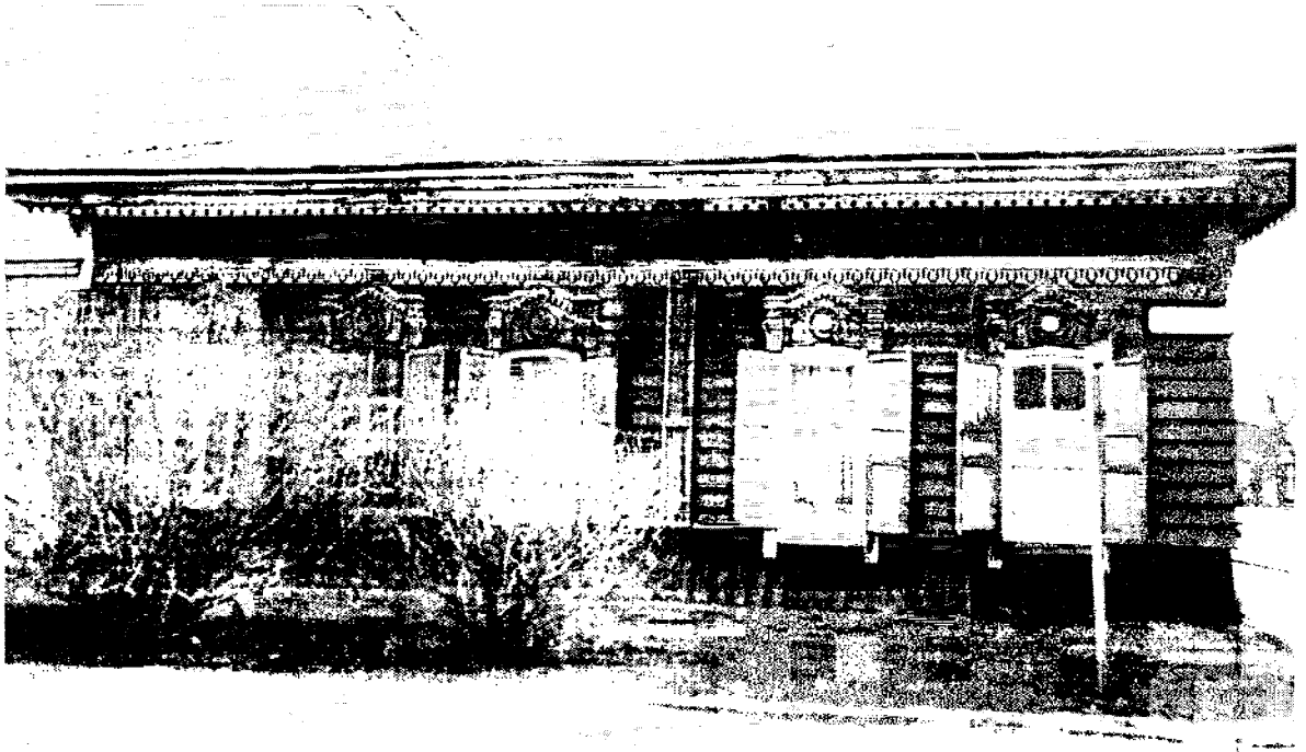
Фото 3 – Фасад по ул. Гаврилова