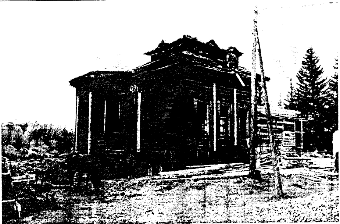
3. Общий вид с северо-востока с ул. Социалистической