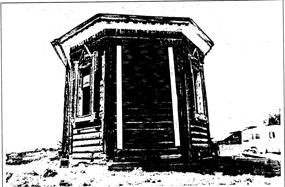
4. Восточный фасад