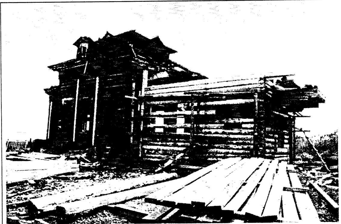
2. Общий вид с северо-запада с ул. Социалистической