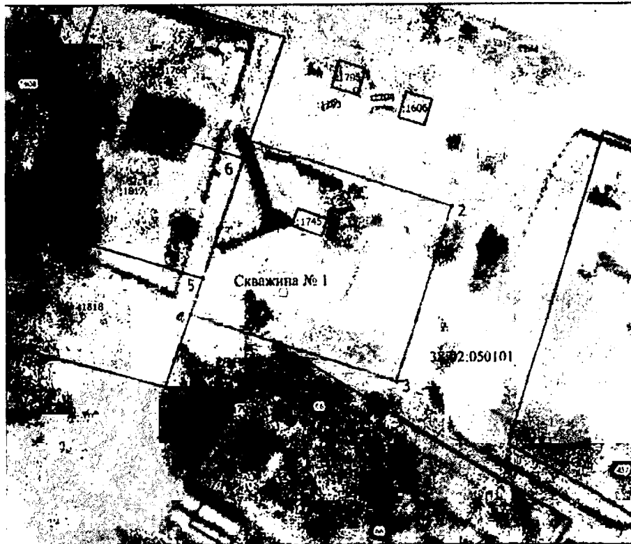
План границ объекта

Второй пояс зоны санитарной охраны водозабора подземных вод со скважиной № 1 по ул. Советская, 11 для хозяйственно-питьевого водоснабжения в с. Кузнецовка Братского района Иркутской области, устанавливающей границы ЗСО подземного водоисточника и ограничения использования земельных участков в границах поясов ЗСО