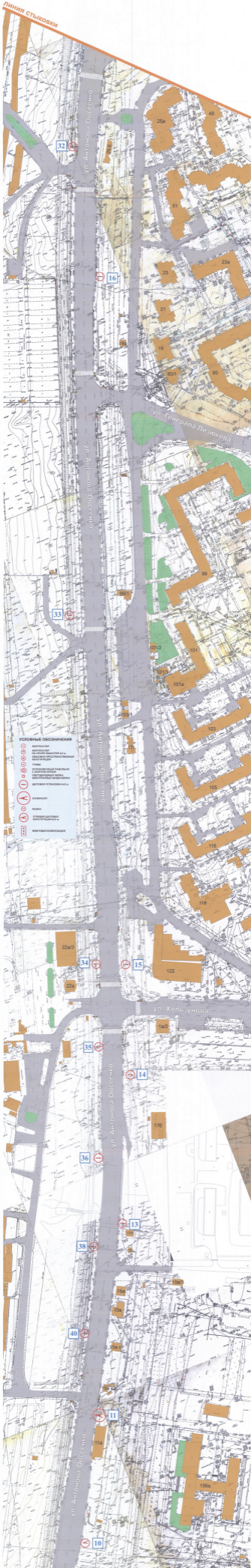
СХЕМА РАЗМЕЩЕНИЯ РЕКЛАМНЫХ КОНСТРУКЦИЙ НА ТЕРРИТОРИИ ГОРОДСКОГО ОКРУГА ГОРОД ВОРОНЕЖ ДЛЯ УЧАСТКА ТЕРРИТОРИИ: улица Антонова-Овсенко М 1:1000