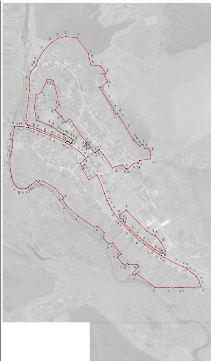
Рисунок 6 План участка 0000-08