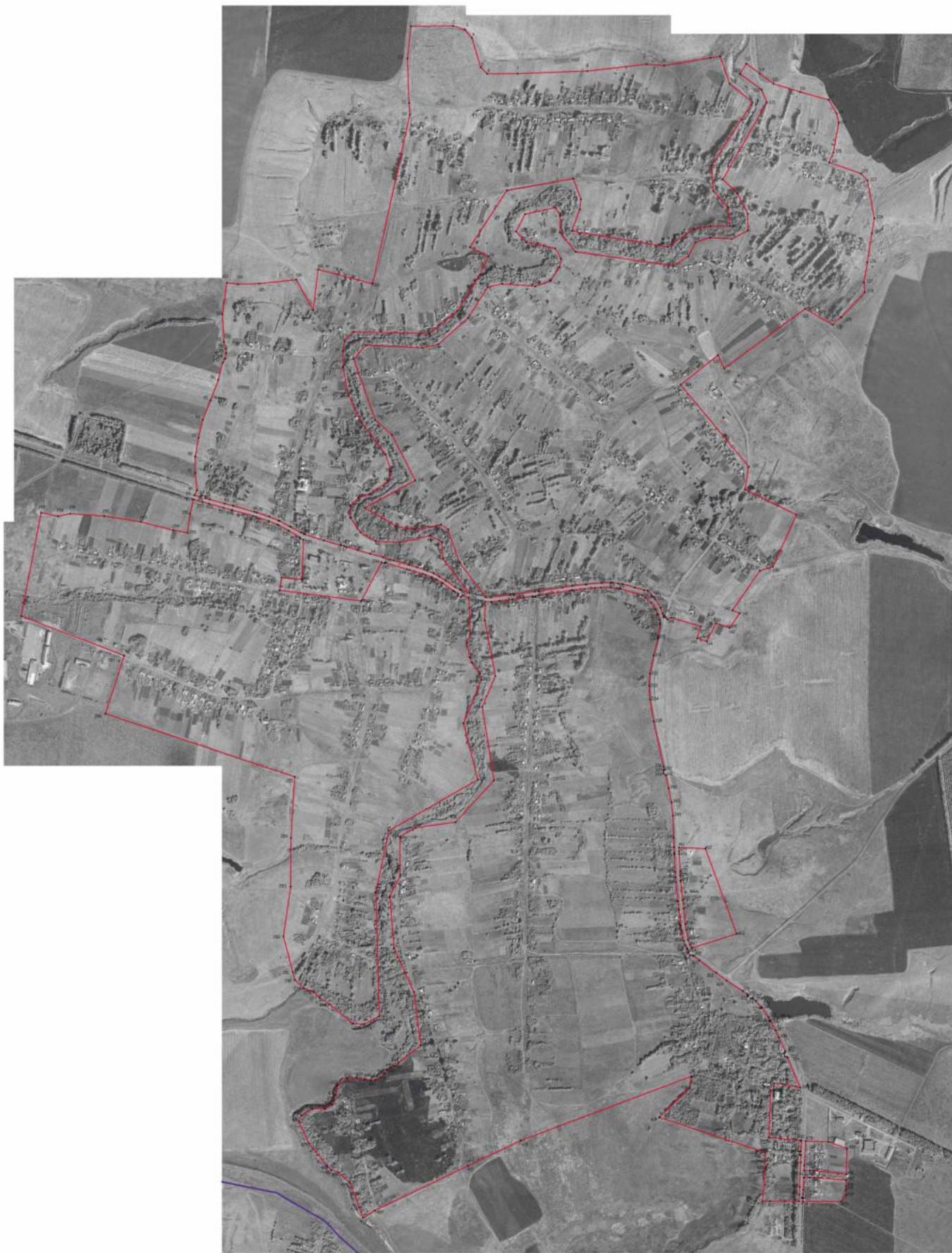
Рисунок 4 План границ объектов