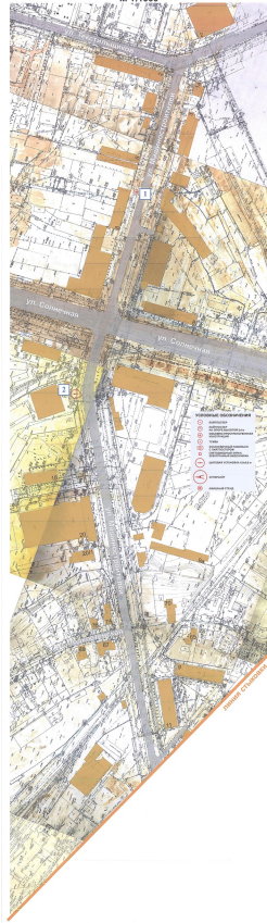
СХЕМА РАЗМЕЩЕНИЯ РЕКЛАМНЫХ КОНСТРУКЦИЙ НА ТЕРРИТОРИИ ГОРОДСКОГО ОКРУГА ГОРОД ВОРНЕЖЬ ДЛЯ УЧАСТКА ТЕРРИТОРИИ: улица Машиностроителей М 1:1000