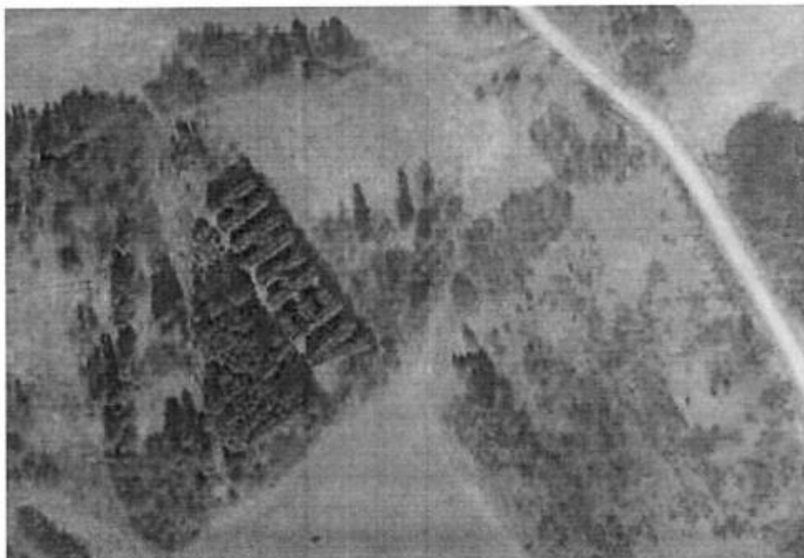
Рис.1 Общий вид ландшафта с расположением на нем геоглифа «Ленин»

народных комиссаров РСФСР и Совета народных комиссаров СССР, создателя первого в мировой истории социалистического государства.