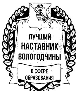
Рисунок нагрудного знака к Почетному званию «Лучший наставник Вологодчины в сфере образования»

Материал – серебристый томпак. Три слоя (3D). Крепление – «бабочка».