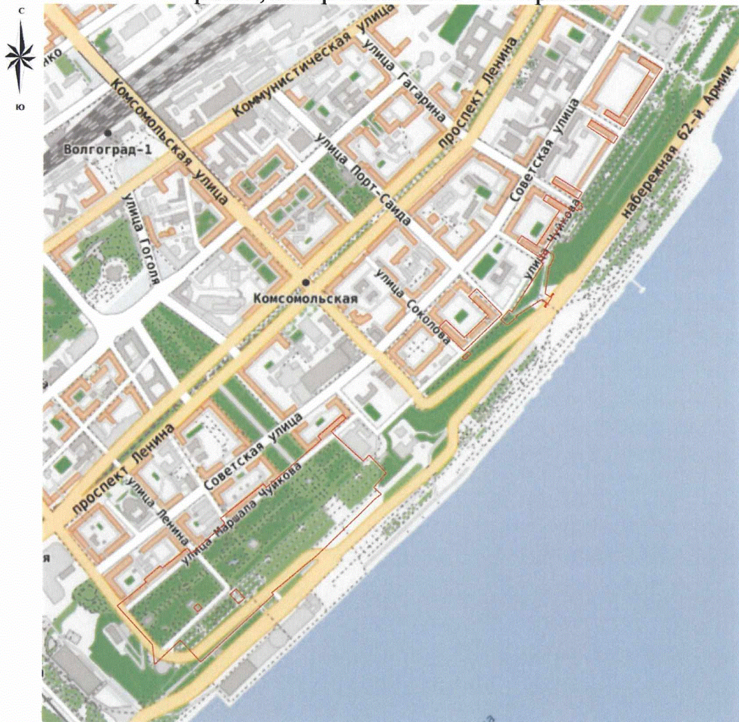
Схема границ территории объекта культурного наследия регионального значения "Ансамбль Набережной р. Волги", расположенного по адресу (местонахождение): Волгоградская область, город Волгоград, Центральный район, набережная им. 62-ой Армии

Границы территории объекта культурного наследия регионального значения "Ансамбль Набережной р. Волги", расположенного по адресу (местонахождение): Волгоградская область, город Волгоград, Центральный район, набережная им. 62-ой Армии 1