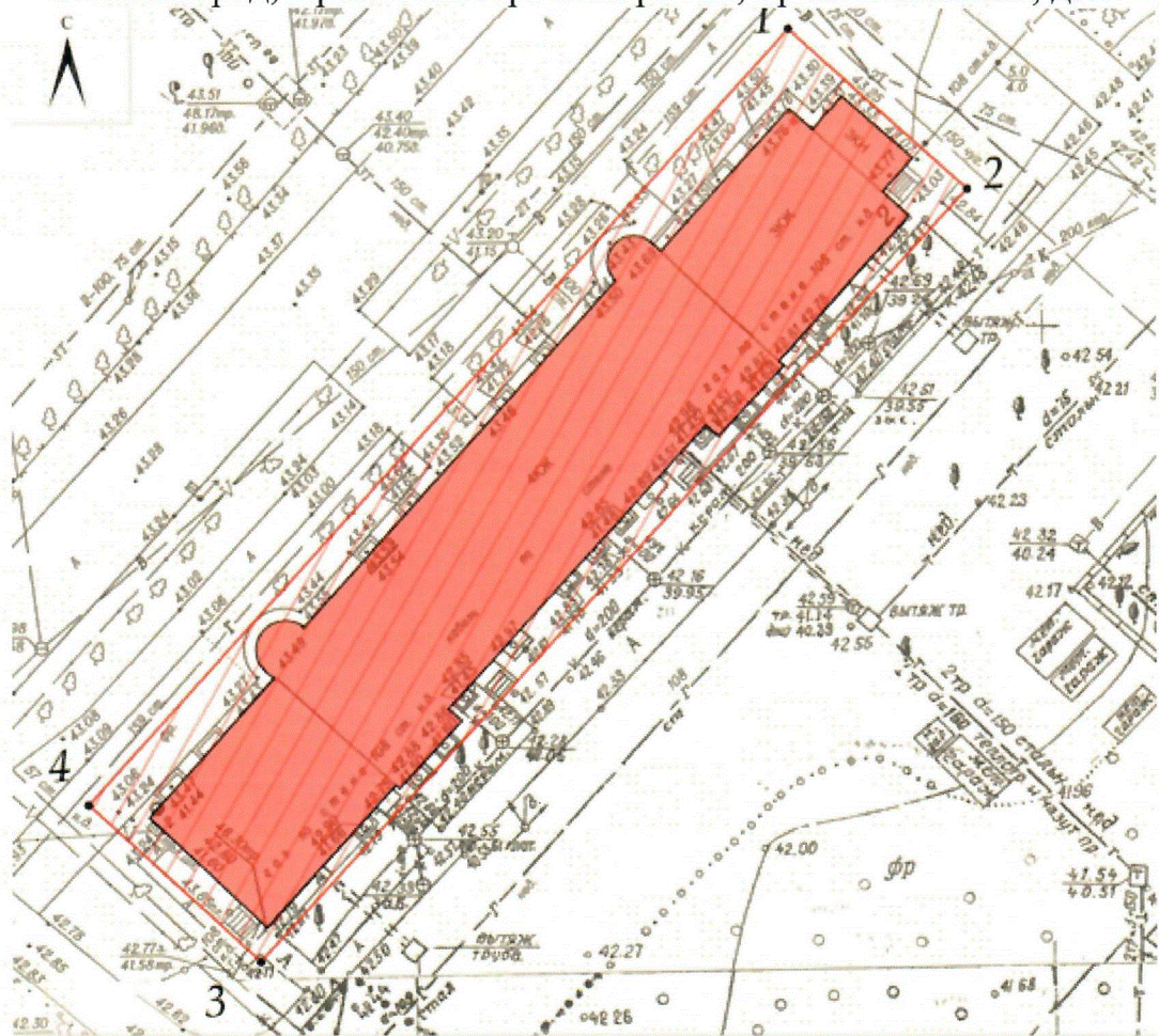
Схема границ территории объекта культурного наследия регионального значения "Дом жилой", расположенного по адресу: Волгоградская область, г. Волгоград, Краснооктябрьский район, пр-кт Волжский, д. 2

Границы и режимы территории объекта культурного наследия регионального значения "Дом жилой", расположенного по адресу: Волгоградская область, г. Волгоград, Краснооктябрьский район, пр-кт Волжский, д. 2