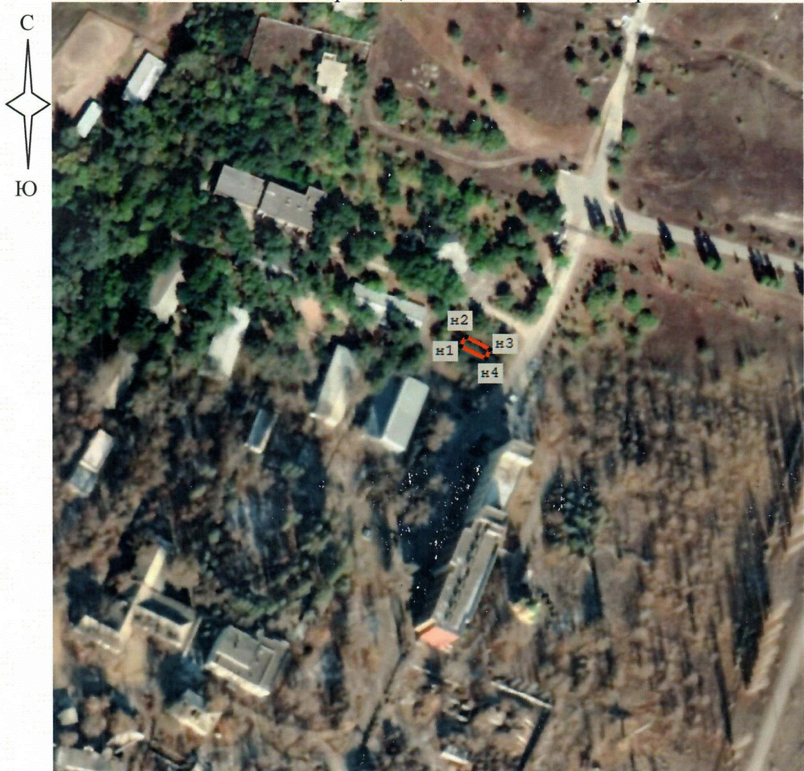
Схема границ территории объекта культурного наследия регионального значения "Братская могила советских воинов, погибших в период Сталинградской битвы", расположенного по адресу: Волгоградская область, Иловлинский район, Качалинский санаторий