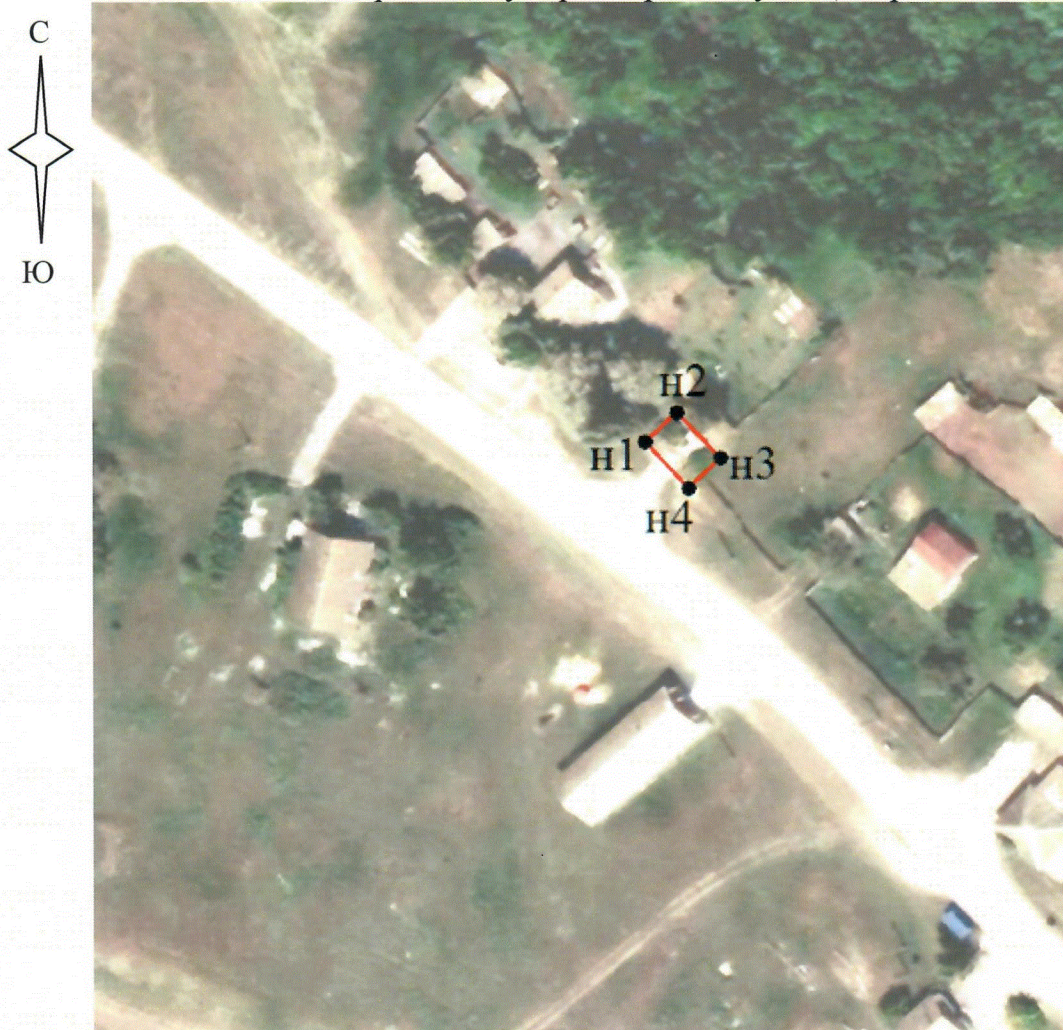
Схема границ территории объекта культурного наследия регионального значения "Братская могила советских воинов, погибших в период Сталинградской битвы", расположенного по адресу: Волгоградская область, Иловлинский район, хутор Широков, ул. Центральная