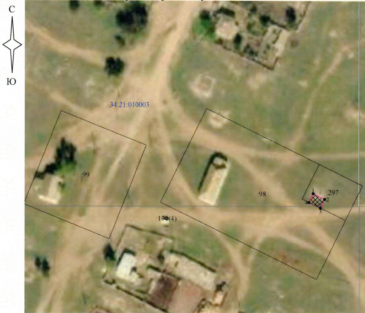
Схема границ территории объекта культурного наследия регионального значения "Братская могила советских воинов, погибших в период Сталинградской битвы", расположенного по адресу: Волгоградская область, Октябрьский район, хут. Молокановский 1