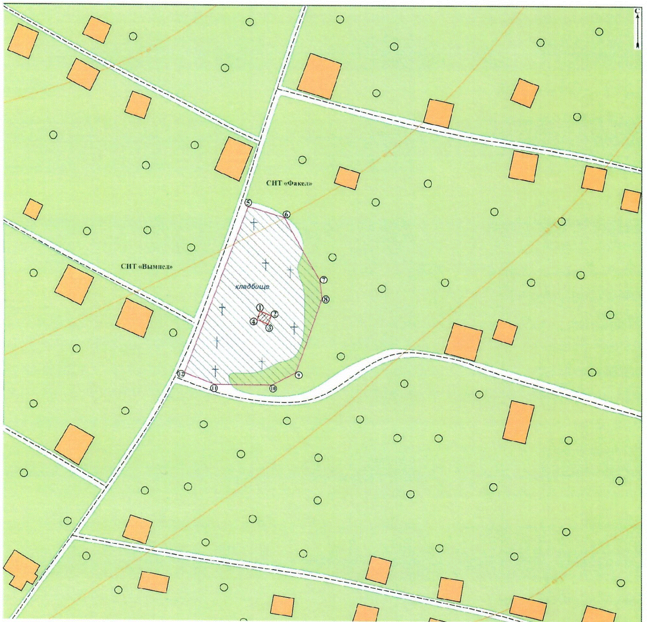
Схема зон охраны объекта культурного наследия регионального значения "Братская могила советских воинов, погибших в период Сталинградской битвы", расположенного по адресу: Волгоградская область, Городищенский район, с. Винновка

к приказу комитета государственной охраны объектов культурного наследия Волгоградской области от 09.09.2019 № 149