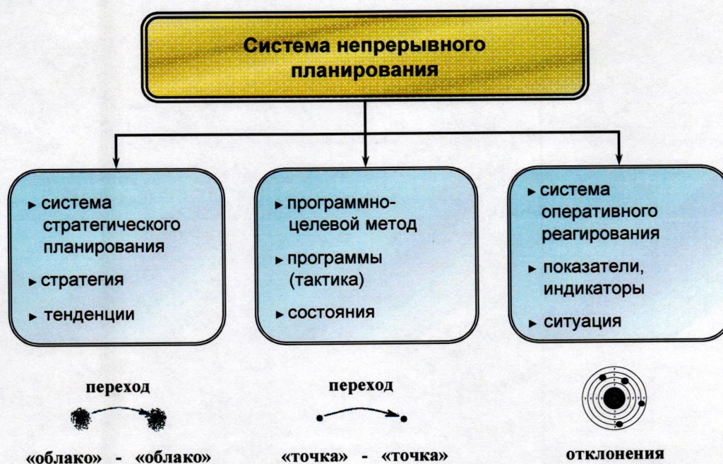
Рисунок 1. Схема непрерывного планирования

Стратегическое планирование предусматривает построение системы непрерывного планирования в регионе. Основным элементом системы стратегического планирования является Стратегия, она рассматривается как процесс (метод) перехода из текущего поля тенденций развития региона в прогнозное поле тенденций развития, соответствующих выбору приоритетов и целей социально-экономического развития. При этом важнейшее значение при разработке Стратегии имеет объективное определение тенденций.