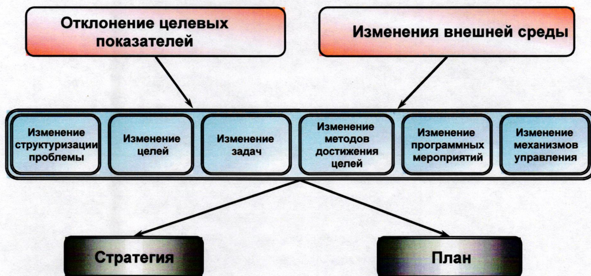
Рисунок 3. Система реагирования на отклонения целевых показателей и изменение внешней среды

В качестве субъектов системы оперативного реагирования выступают государственные органы исполнительной власти Владимирской области, органы местного самоуправления и администрации хозяйствующих субъектов (аппарат управления, менеджеры предприятий и организаций).