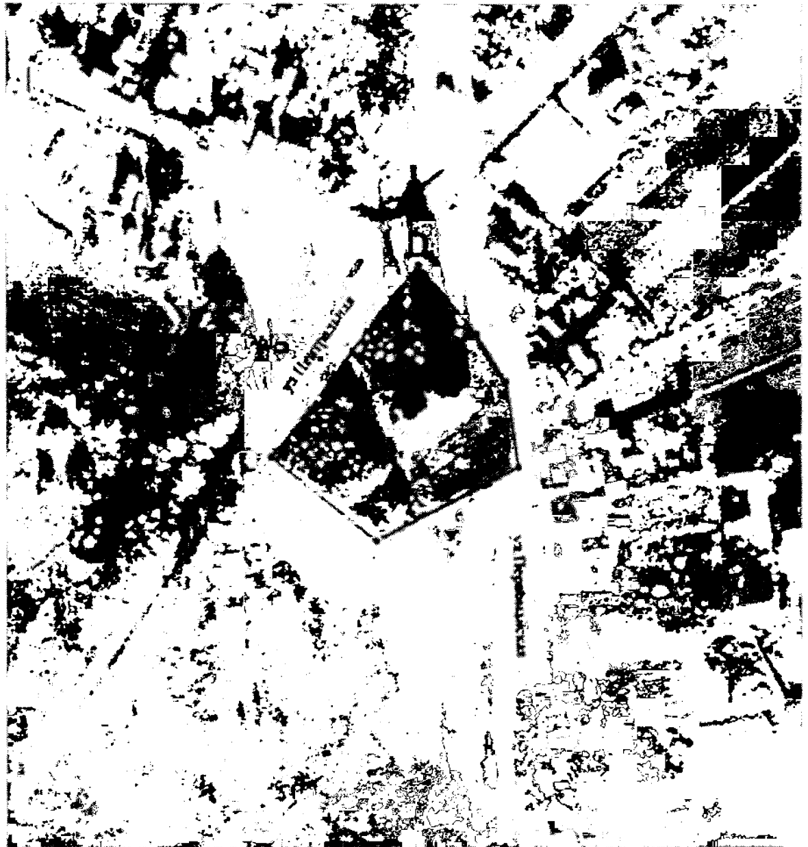
Схема границ территории объекта культурного наследия регионального значения «Казанская церковь»