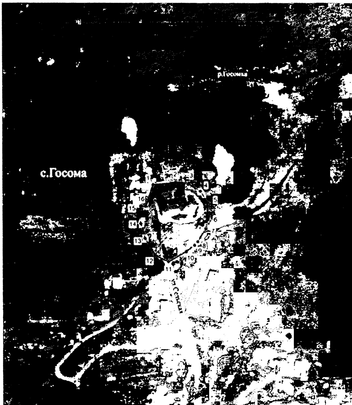
Схема границ территории объекта культурного наследия регионального значения «Церковь Бориса и Глеба»