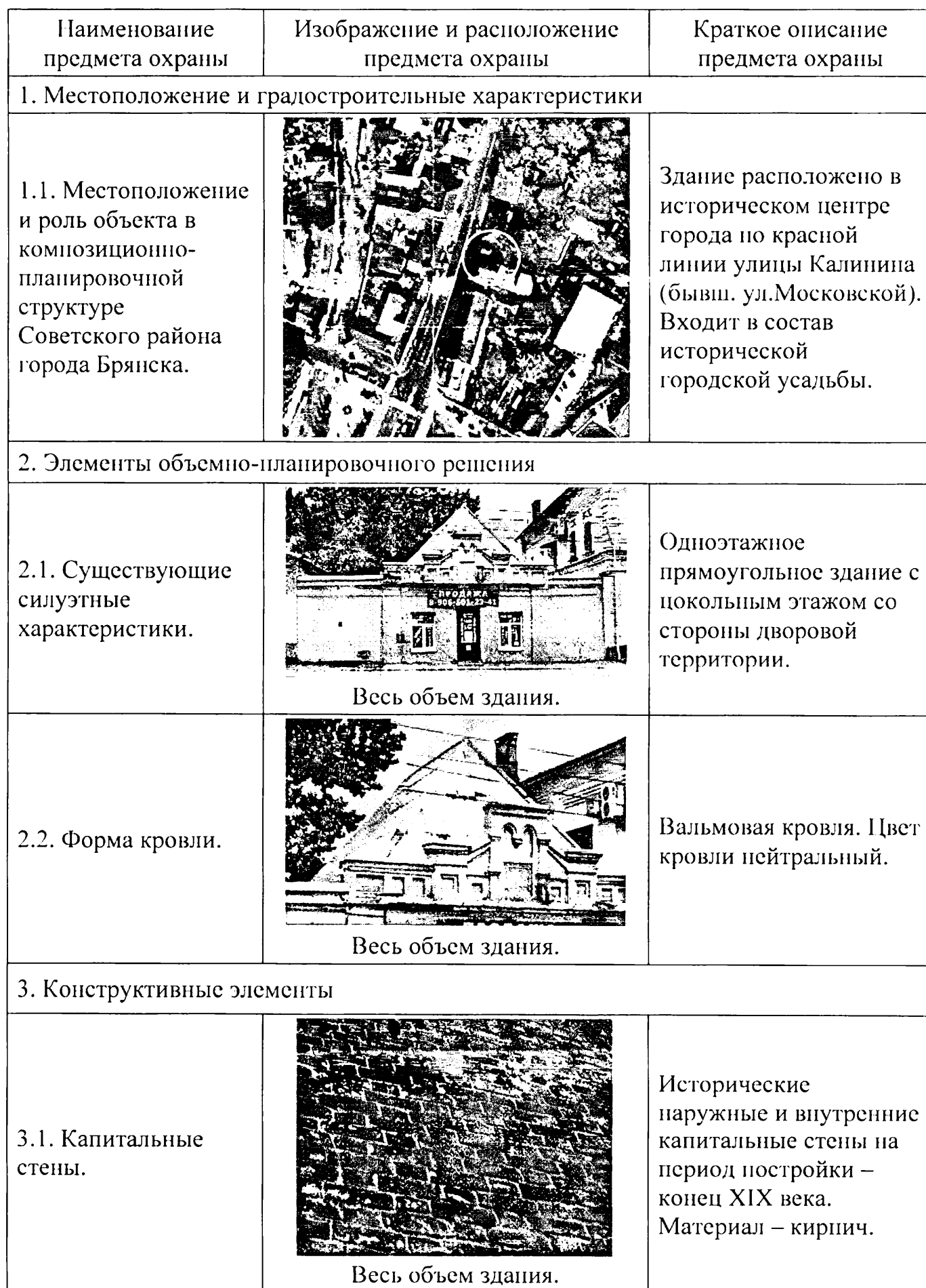
Таблица расположения предмета охраны объекта культурного наследия регионального значения «Магазин - лабаз», конец XIX в., расположенного по адресу: Брянская область, г. Брянск, ул.Калинина, д. 90