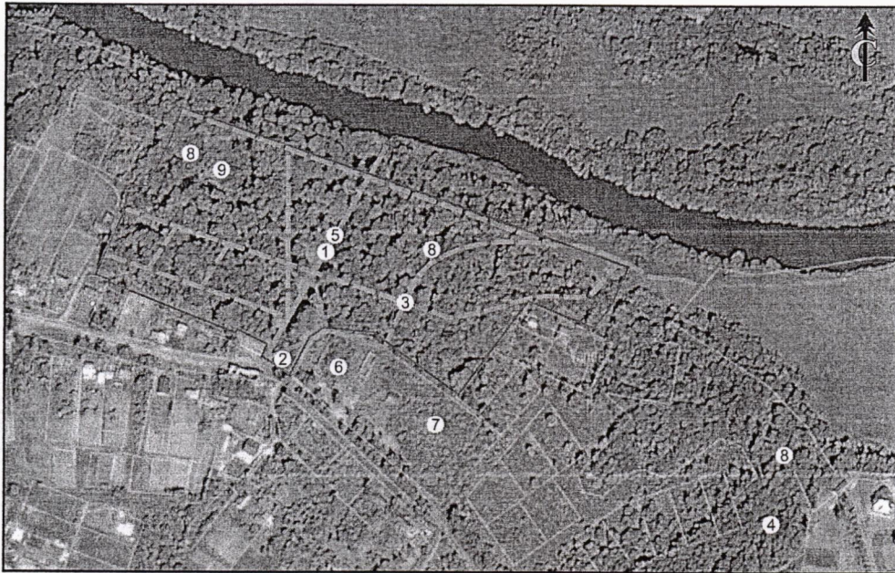
Карта (схема) границ территории выявленного объекта культурного наследия "Парк усадьбы Тенишевых", расположенного по адресу: Брянская обл., Брянский р-н, с.Хотылево