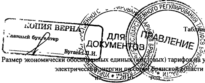
Таблица 1 к приказу управления государственного регулирования тарифов Брянской области от 30 декабря 2015 г. № 44/1-э

Размер экономически обоснованных единых (котловых) тарифов на услуги по передаче электрической энергии по сетям Брянской области