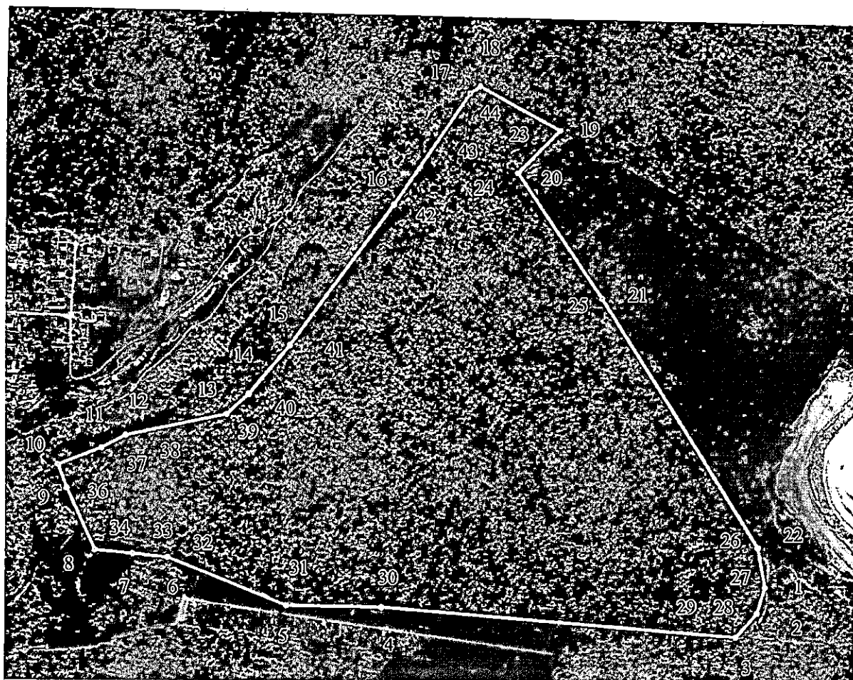
Карта-схема охранной зоны