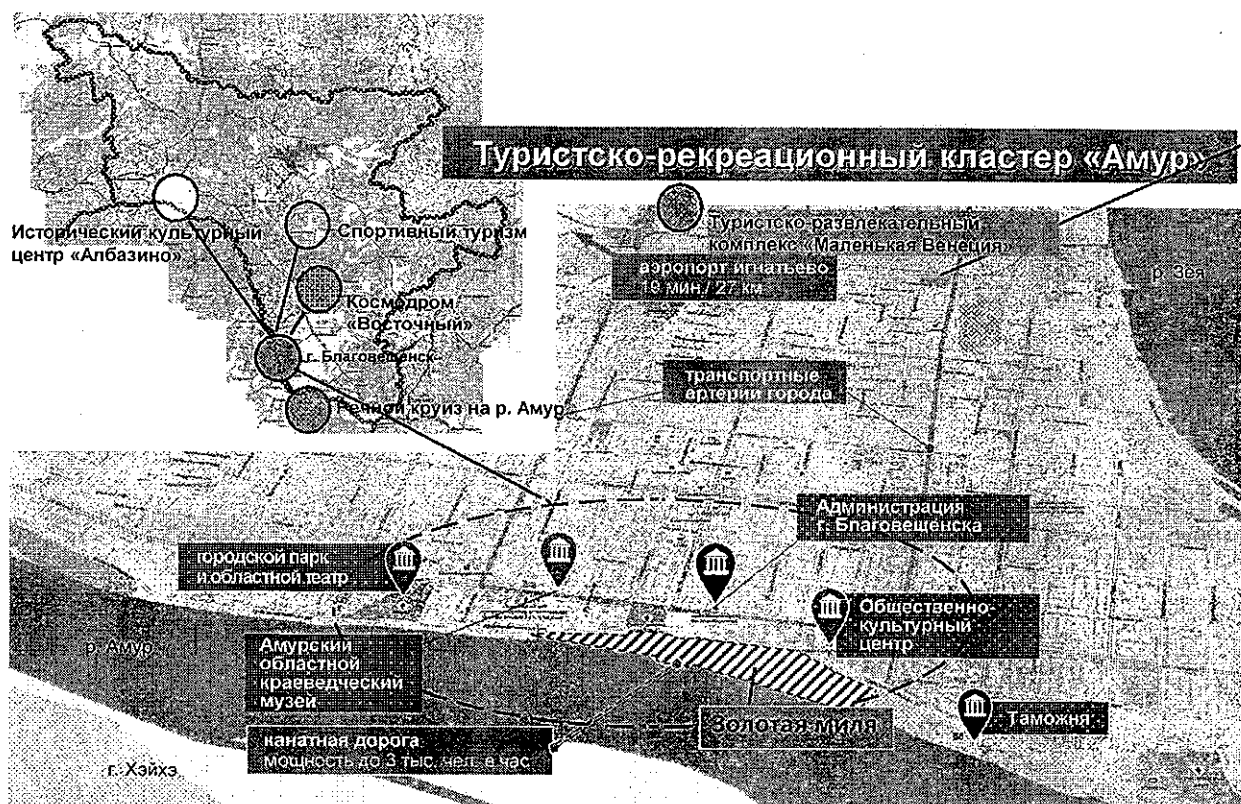
Схема создания и развития ТРК «АМУР» содержит два последовательных и взаимосвязанных этапа:

Основная специализация ТРК «АМУР» - культурно-познавательный туризм.