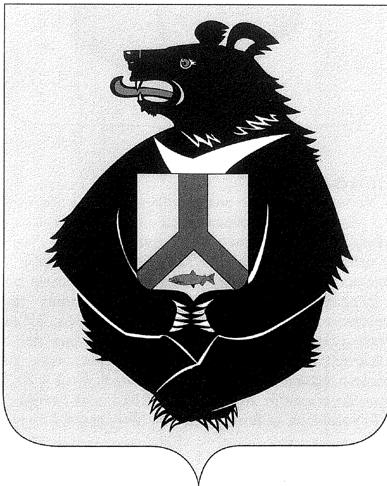
Рисунок герба в многоцветном варианте

«Приложение 2 к Закону Хабаровского края от 26.09.2001 № 324