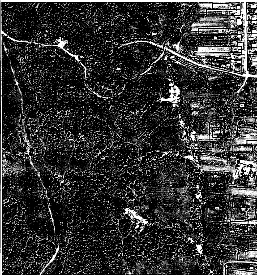
Масштаб 1:4 000

Используемые условные знаки и обозначения: