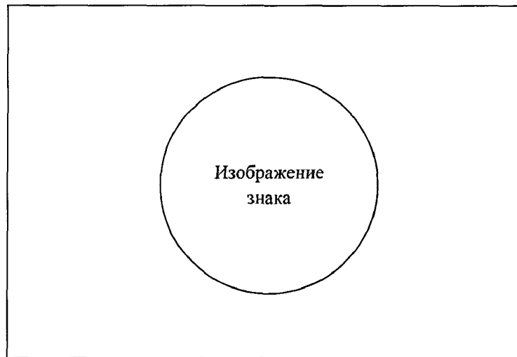
Размер удостоверения – 65 x 95 мм