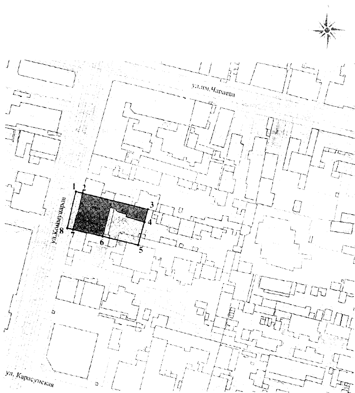
Схема границ территории объекта культурного наследия

территории объекта культурного наследия регионального значения «Дом жилой с торговыми помещениями», начало XX в., Краснодарский край, г. Краснодар, ул. Коммунаров, 110, лит. А, А1