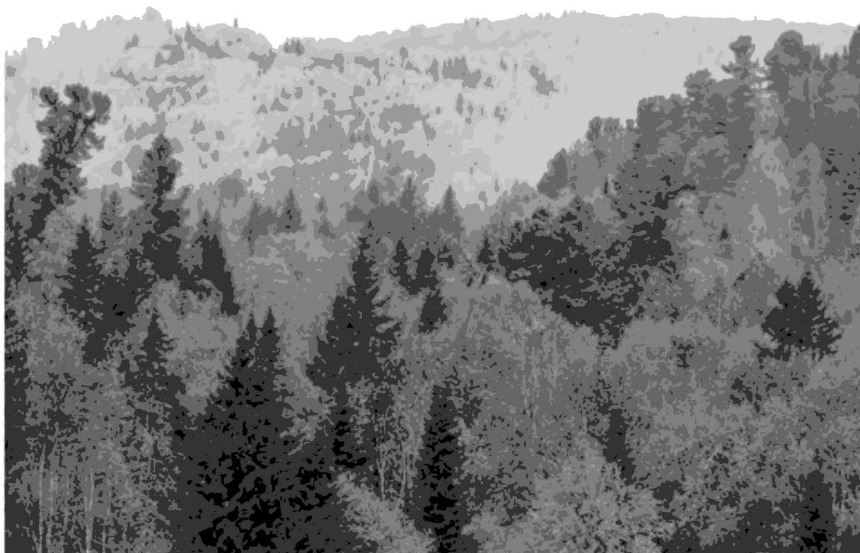
Рис. 1. Черневая тайга Салаира осенью