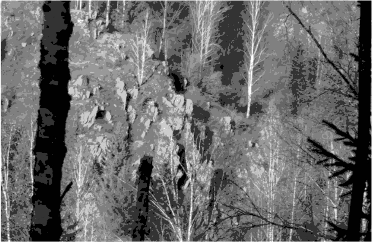
Рис. 2 . Скальные останцы