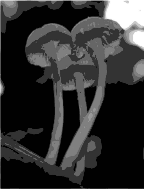
Рис. 4. Хромозера синепластинковая – Chromosera cyanophylla