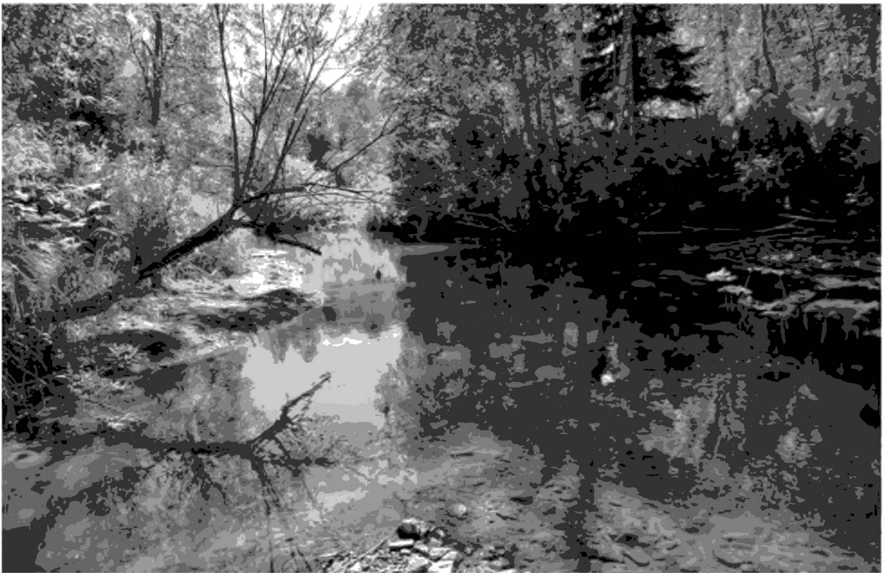
Рис. 3. Река Северный Тогул в верховьях