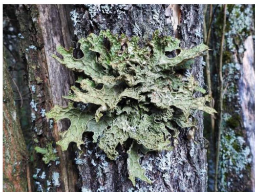
Рисунок 4. Лобария лёгочная