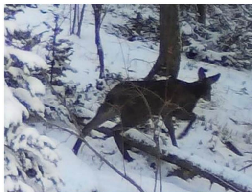
Рисунок 5. Сибирская кабарга