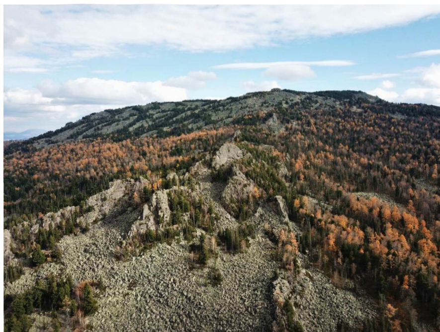
Рисунок 2. Скалы-останцы и курумы на склоне горы Бутачиха