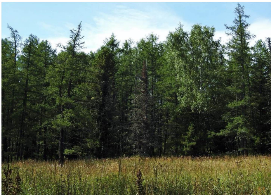
Рисунок 3. Лиственничник на юго-восточном склоне г. Бутачиха