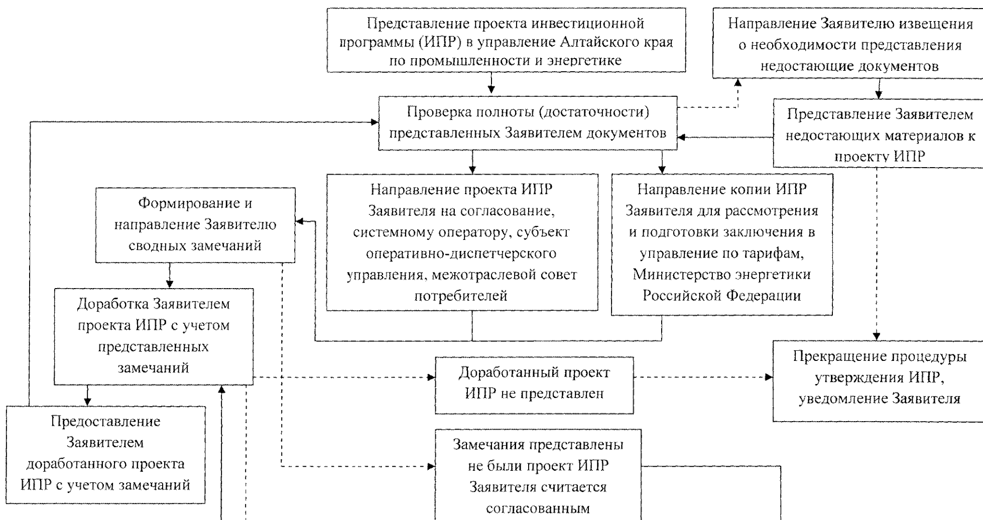
Блок-схема последовательности административных процедур при предоставлении государственной услуги