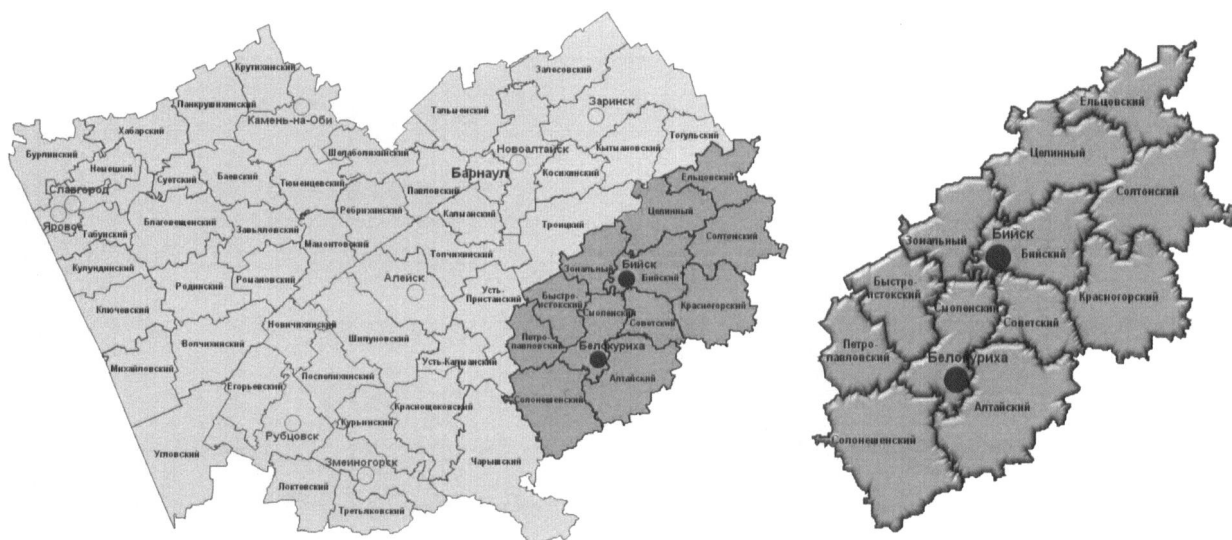
Рис 1. Административно-территориальная структура ЮВЗ

В Стратегии социально-экономического развития Алтайского края до 2025 года выделены 4 зоны экономического роста. Одной из них является Юго-Восточная (далее также – ЮВЗ), территория которой объединяет городские округа г. Бийск и г. Белокуриха, а также Алтайский, Бийский, Быстроистокский, Ельцовский, Зональный, Красногорский, Петропавловский, Смоленский, Советский, Солонешенский, Солтонский и Целинный муниципальные районы. Границы ЮВЗ совпадают с границами Бийского управленческого округа. Город Бийск определен стратегией социально-экономического развития Алтайского края до 2025 года как один из двух центров социально-экономического развития наряду с Барнаульской агломерацией (рис.1).