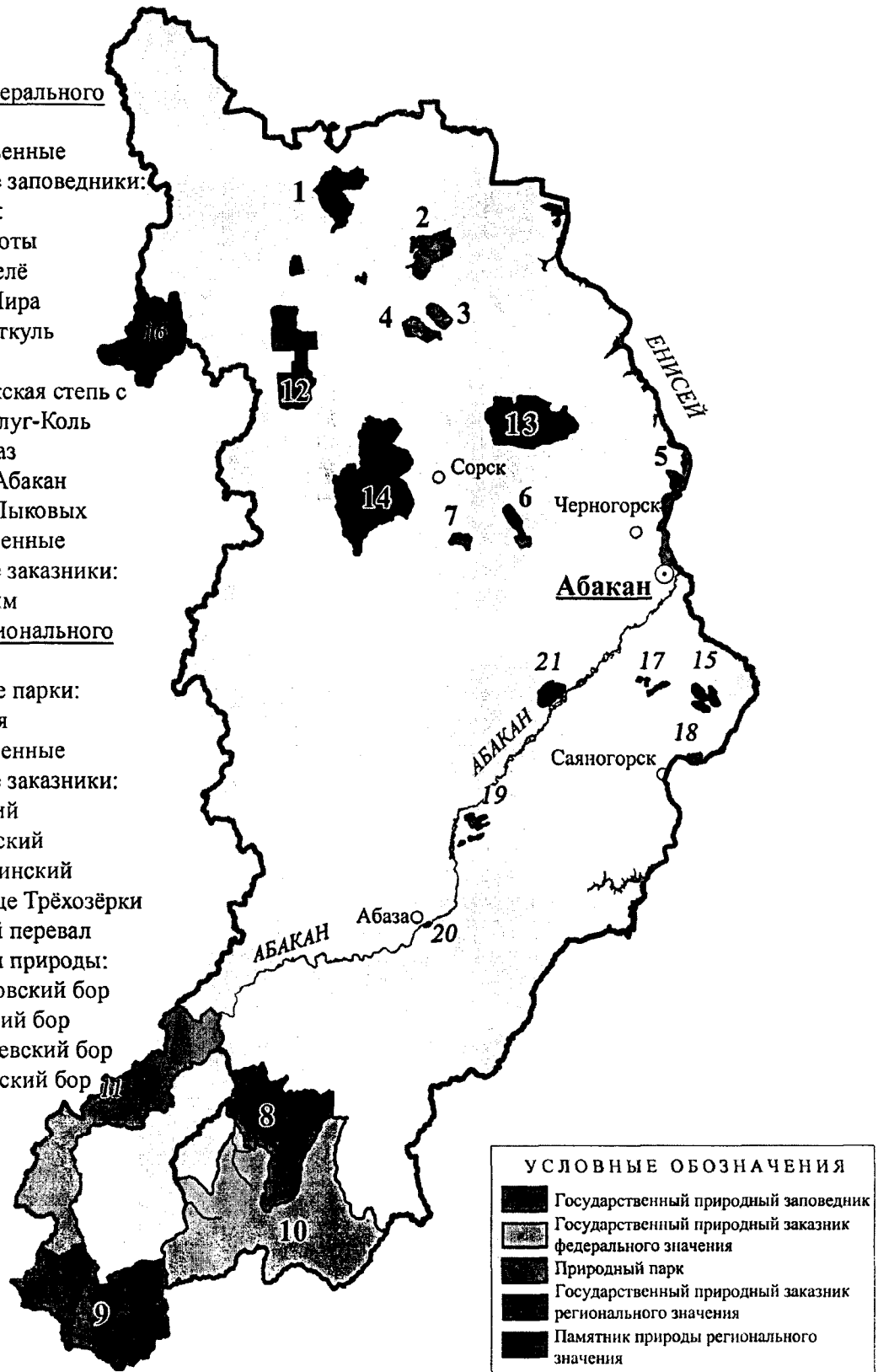
Рисунок 2. – Памятник природы «Абазинский бор» в системе особо охраняемых природных территорий Республики Хакасия

17. Смирновский бор 18. Очурский бор 19. Бондаревский бор 20. Абазинский бор 21. Уйтаг