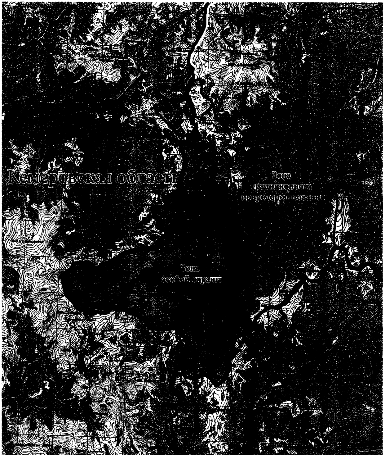
Рис. 1. Карта-схема расположения границ особо охраняемой природной территории регионального значения – государственный природный заказник «Олений перевал»