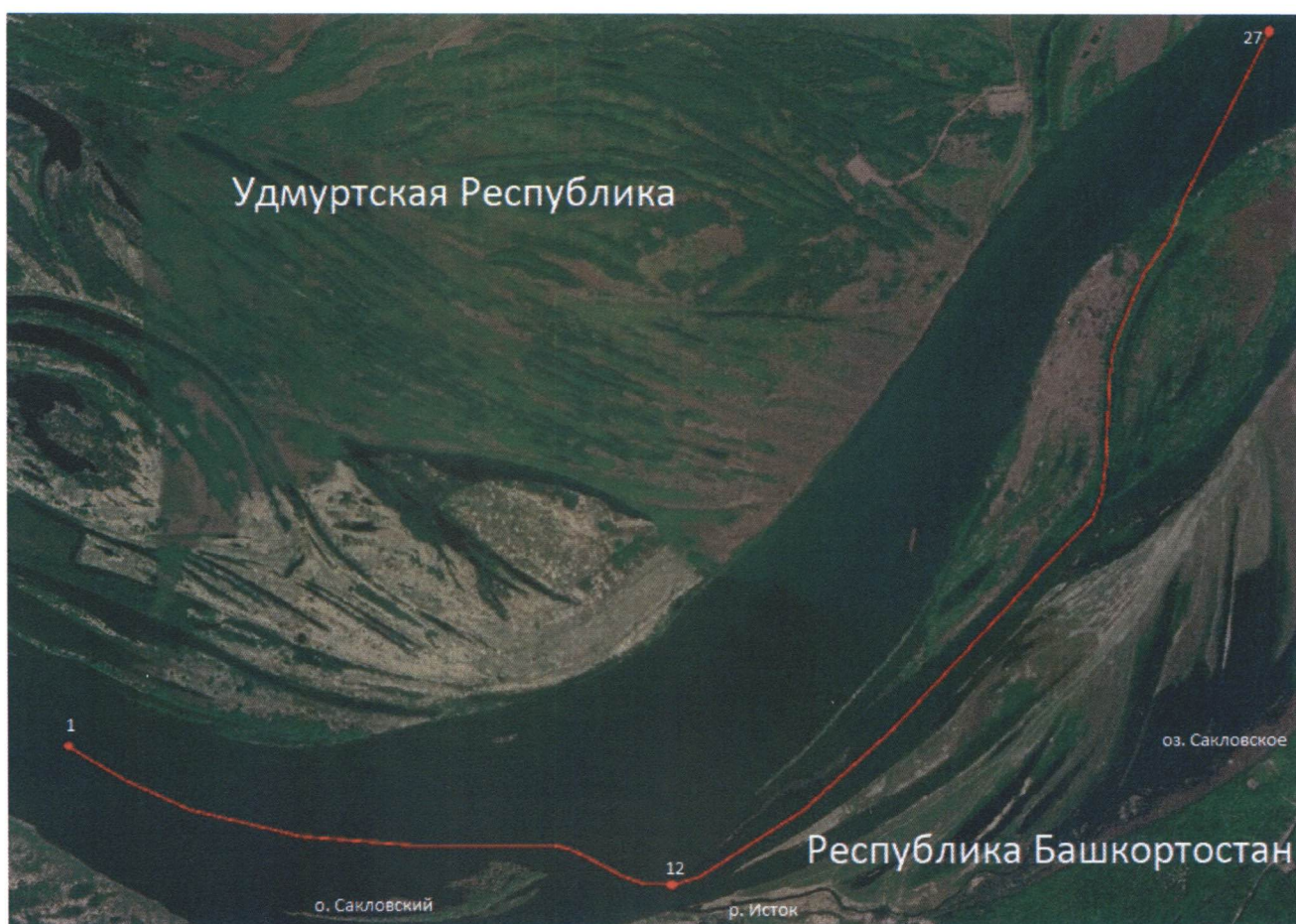
СХЕМА части границы между субъектами Российской Федерации – Удмуртской Республикой и Республикой Башкортостан