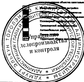
Экспликация объектов и сооружений