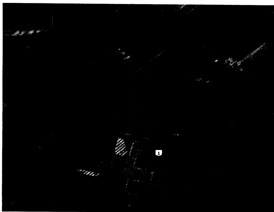
3. Таблица координат охранной зоны объекта культурного наследия (система координат МСК-18):

западном направлении 18 метров до точки 3, далее в северо-восточном направлении вдоль улицы Молодой Гвардии, пересекая улицу Первомайскую, 91 метр через точку 4 до точки 5, далее в юго-восточном направлении 34 метра через точки 6, 7 и 8 до точки 9, далее в юго-западном направлении, пересекая улицу Первомайскую, до точки 10, далее в северо-западном направлении вдоль улицы Первомайской 47 метров через точки 11 и 12 до точки 13, далее в юго-западном направлении вдоль западной границы территории объекта культурного наследия 25 метров до исходной точки 1 согласно схеме: