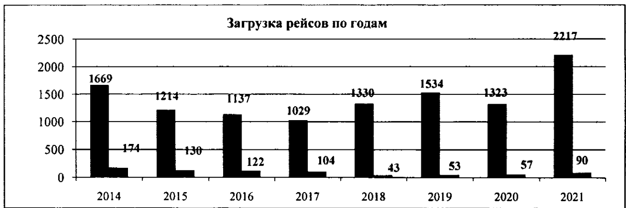
Рисунок 2 – Сравнительная диаграмма количества перевезенных пассажиров с 2014 года по 2021 года

В целях обеспечения регулярных пассажирских перевозок воздушным транспортом и обеспечения равной доступности транспортных услуг для жителей труднодоступных местностей Правительством Республики Тыва начиная с 2007 года ежегодно принимается постановление «Об утверждении льготных тарифов на перевозку пассажиров воздушным транспортом на местных воздушных линиях Республики Тыва», которым определяется предельная величина стоимости летного часа, размер льготных тарифов на текущий год и перечень категорий граждан, имеющих право на получение льгот при пользовании воздушным транспортом на территории республики.