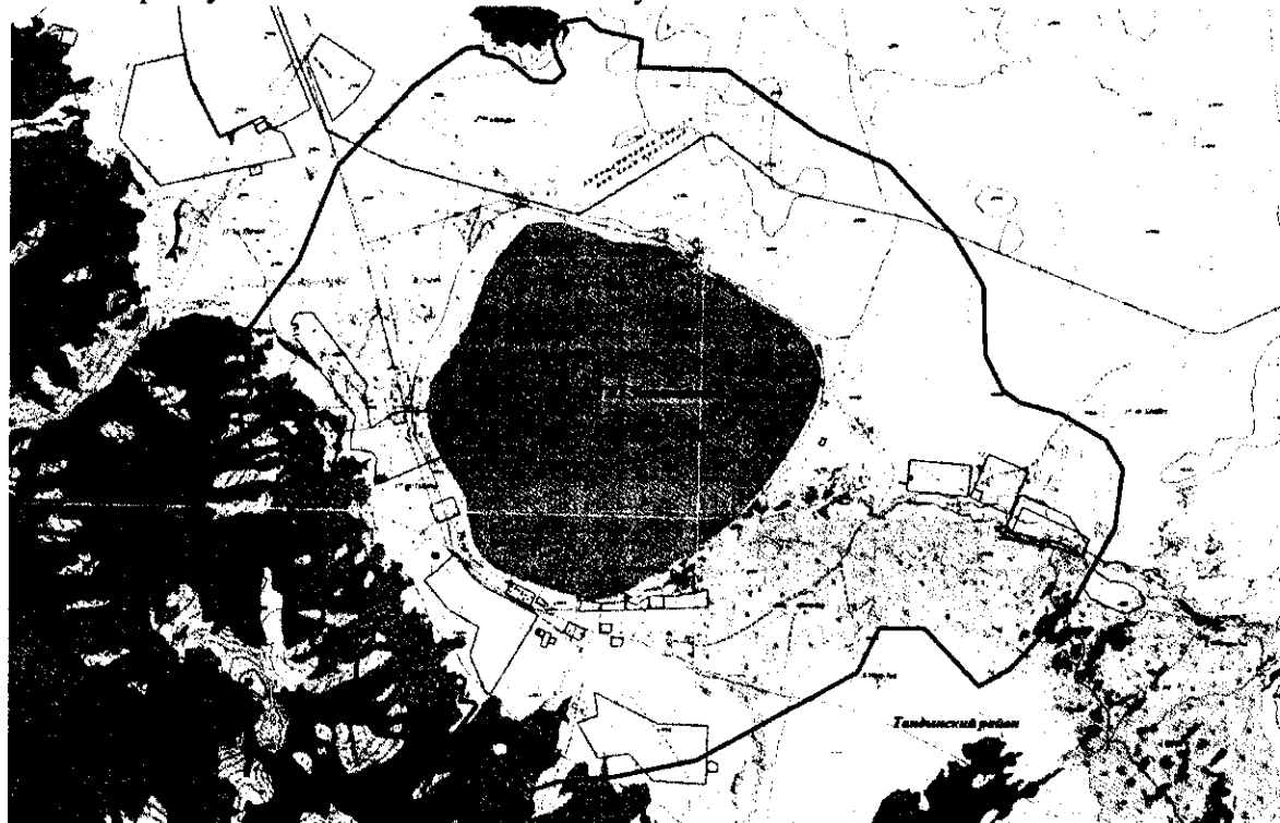
Карта-схема расположения границы государственного природного заказника республиканского значения Республики Тыва «Чагыттайский»