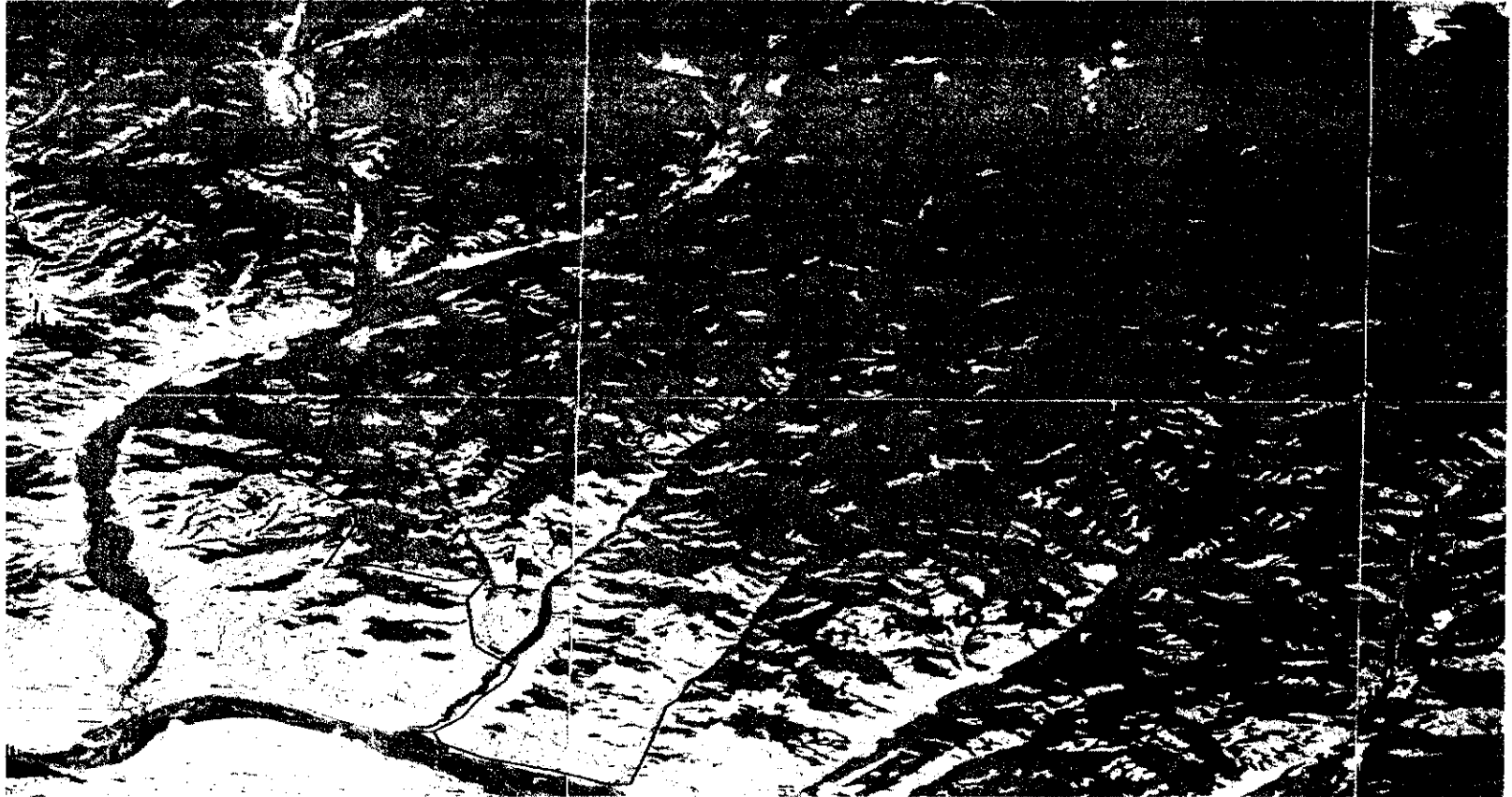
Карта-схема расположения границы государственного природного заказника республиканского значения Республики Тыва «Шанский»