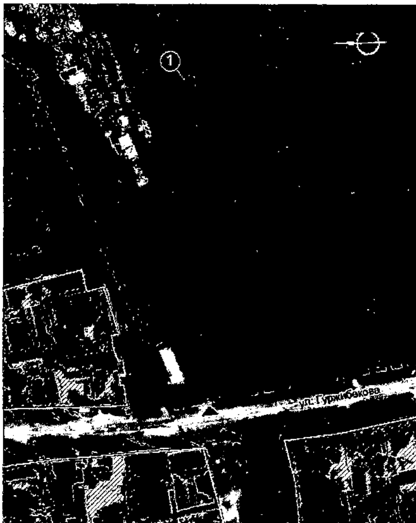
Схема ген. плана

Республика Северная Осетия-Алания, Моздокский район, ст. Новоосетинская, ул. Гуржибекова Могила Блашка Гуржибекова, классика осетинской литературы