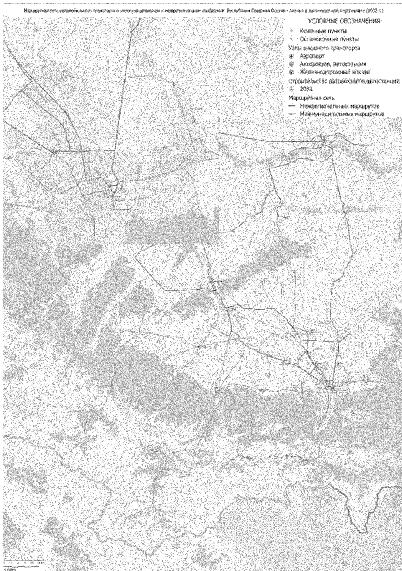
Рисунок 2 - Схема маршрутной сети на 2032 год