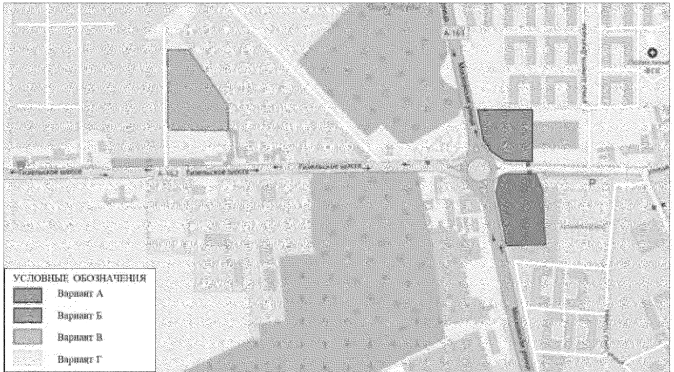
Рисунок 4.1 – Варианты размещения автостанции

автостанции приведены на рисунке 4.1. Окончательное решение по выбору варианта размещения будет принято администрацией г. Владикавказа.