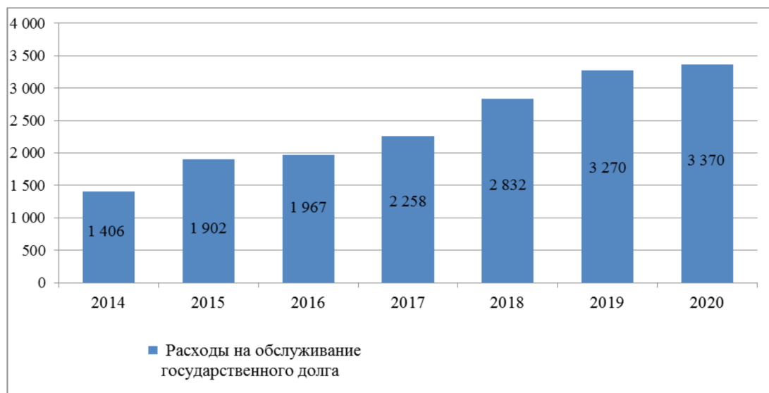
График 2. Расходы на обслуживание государственного долга Республики Саха (Якутия), млн рублей.

За 2014-2016 годы все платежи по погашению и обслуживанию долговых обязательств Республики Саха (Якутия) производились своевременно и в полном объеме.