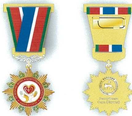
Рисунок почетного знака Республики Саха (Якутия) «Амарах сурэх» («За добрую волю и благотворительность»)

Знак подвешивается за ушко и кольцо к пятиугольной колодке, обтянутой муаровой лентой в голубом, белом, красном и зеленом цветах. Ширина ленты – 20 мм, цветных полос: голубой – 8 мм, белой – 2 мм, красной – 8 мм, зеленой – 2 мм. На нижнем основании колодки – лавровые венки с серебрением. Размеры колодки 38x47x25 мм.