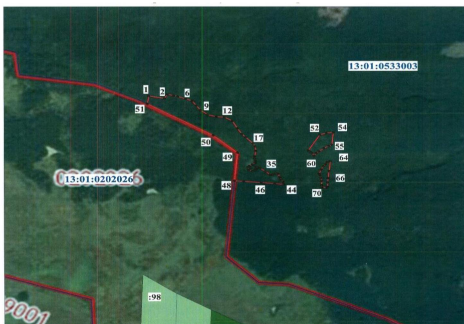
Схема границ памятника природы регионального значения Республики Мордовия «Участок леса»