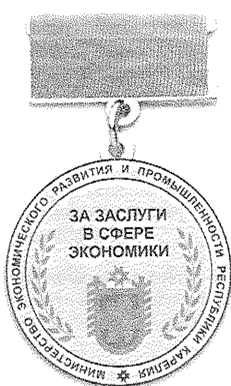
Рисунок ведомственной награды Министерства экономического развития и промышленности Республики Карелия - Медали Министерства экономического развития и промышленности Республики Карелия «За заслуги в сфере экономики»