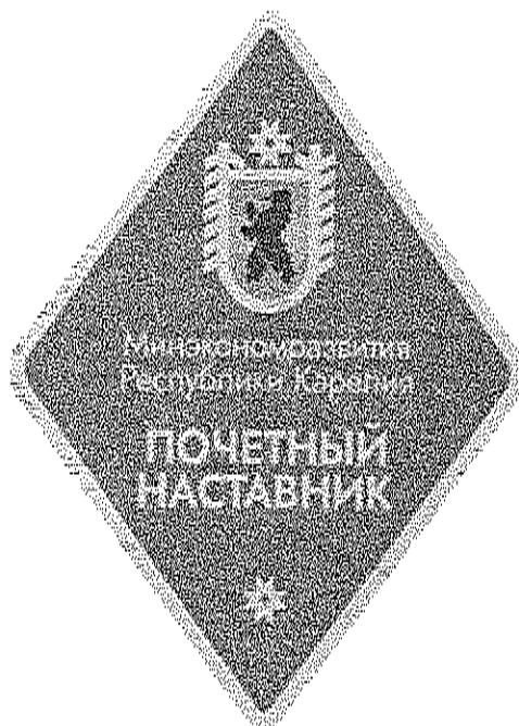
Рисунок ведомственного знака отличия Министерства экономического развития и промышленности Республики Карелия - Знака отличия «Почетный наставник»

«Приложение №3 к Положению о ведомственных наградах и знаке отличия Министерства экономического развития и промышленности Республики Карелия