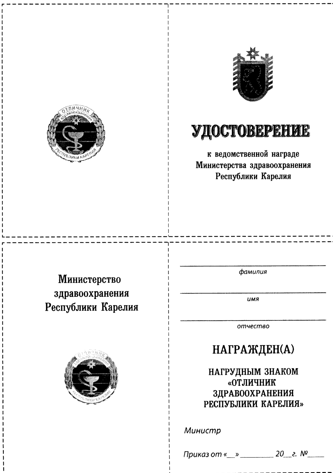
Рисунок удостоверения нагрудного знака «Отличник здравоохранения Республики Карелия».

УТВЕРЖДЕН Приказом Министерства здравоохранения Республики Карелия от 21.07.2020 № 1067