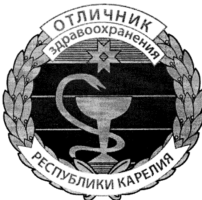
Рисунок нагрудного знака «Отличник здравоохранения Республики Карелия».

УТВЕРЖДЕН Приказом Министерства здравоохранения Республики Карелия от 21.07.2020 № 1067