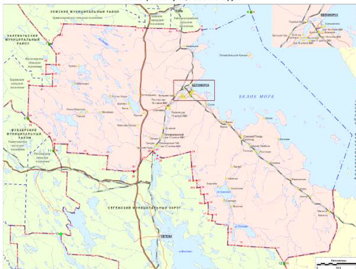
Картографическая схема установления границ Беломорского муниципального округа

от т. 11 до т. 10 (узловая точка 12) между кв. 11, 23, 36 Вожмогорского лесничества Сегежского лесхоза и кв. 306, 338, 369, 398, 414 Маленгского лесничества Сумского лесхоза до южного угла кв. 414.