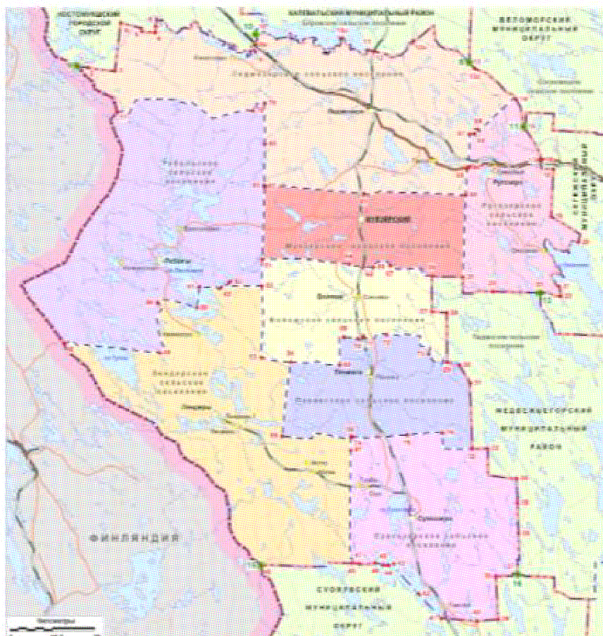
Картографическая схема установления границ Муезерского муниципального района

картографическую схему «Картографическая схема установления границ Муезерского муниципального района» заменить новой картографической схемой «Картографическая схема установления границ Муезерского муниципального района».