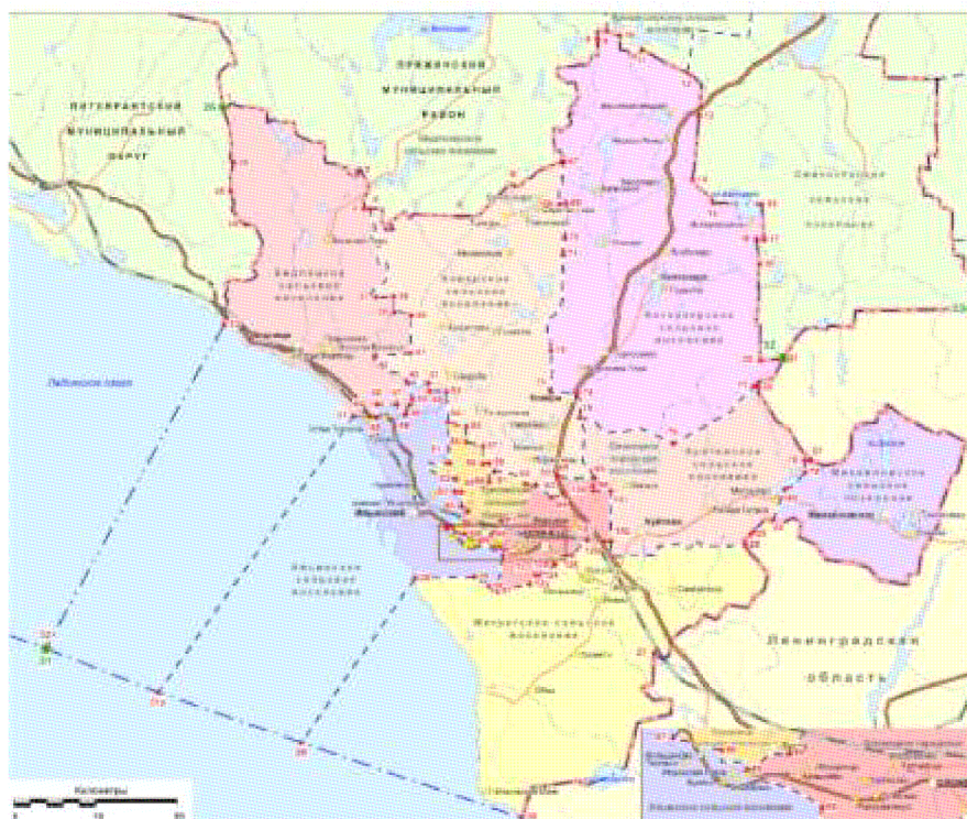
Картографическая схема установления границ Олонецкого муниципального района

картографическую схему «Картографическая схема установления границ Олонецкого муниципального района» заменить новой картографической схемой «Картографическая схема установления границ Олонецкого муниципального района».