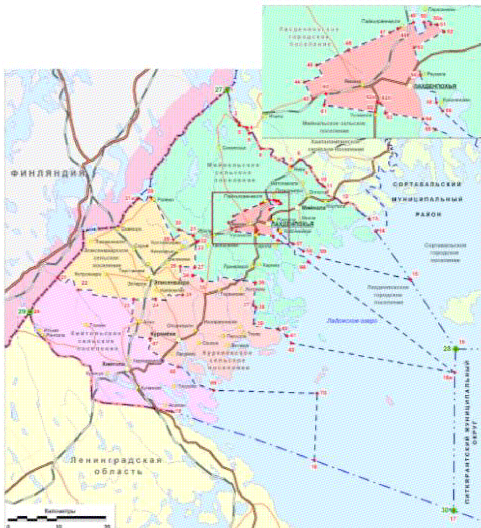
Картографическая схема установления границ Лахденпохского муниципального района

картографическую схему «Картографическая схема установления границ Лахденпохского муниципального района» заменить новой картографической схемой «Картографическая схема установления границ Лахденпохского муниципального района».