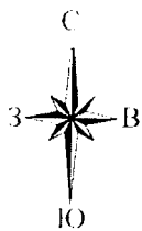
Схема границ объекта культурного наследия местного (муниципального) значения «Джангарчи Ээлян Овла», 1990 год, расположенного по адресу: Республика Калмыкия, г. Элиста, Парк культуры и отдыха «Дружба». М 1:1000